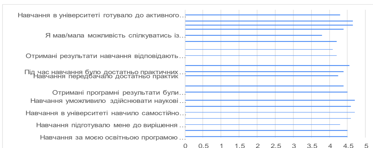
Рис. 1. Оцінювання студентами-випускниками реалізації освітніх програм другого (магістерського) рівня вищої освіти у НаУОА у 2024 році (макс.5 балів).

Водночас гарантам освітніх програм варто звернути увагу на твердження, яке отримало найнижчі оцінки: «Я мав/мала можливість спілкуватись із роботодавцями під час навчання (зустрічі, обговорення, презентації)», – та активізувати роботу зі стейколдерами, урізноманітнити форми такої роботи, популяризувати заходи у форматі «Alumni Talks».