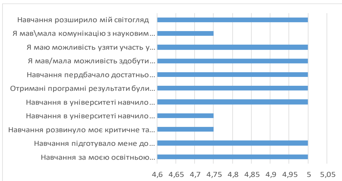
Рис. 3. Оцінювання випускниками реалізації освітніх програм третього (освітньо-наукового) рівня вищої освіти НаУОА у 2023 році (макс.5 балів).

Гарантам освітньо-наукових програм варто звернути увагу на нижчі оцінки від випускників третього (освітньо-наукового) рівня вищої освіти щодо покращення комунікації з науковими керівниками, та проаналізувати можливість покращення оцінок і за іншими твердженнями.